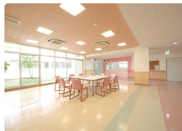
こころ科スーパー救急病棟 病床数：60床

日常生活指導や精神科作業療法などの療養プログラムを積極的に取り入れ、症状に合った様々な治療を行っています。