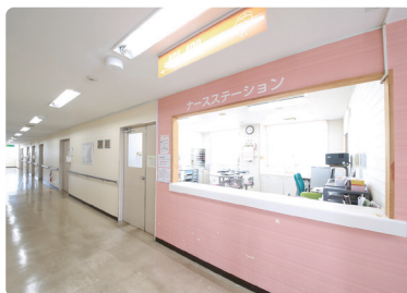
一般科急性期病棟 病床数：60床

当院は二次救急指定病院です。1Fフロアには、救急外来の集約、検査設備の拡充を行い、迅速な救急対応を行います。