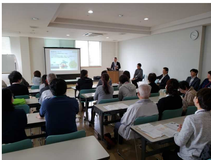
【有村副理事長から事業概要の説明】