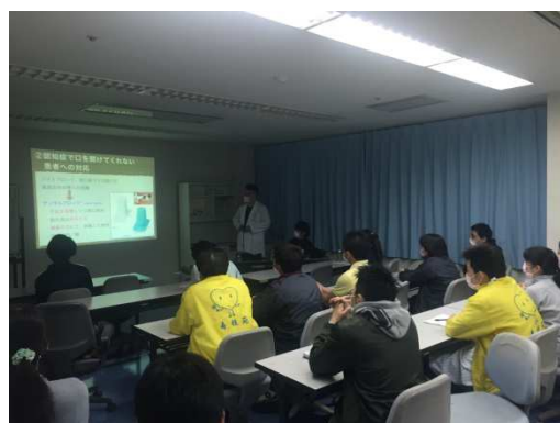
【後藤医師による講演】

清風会グループでは医療事業において身体合併症など内科、外科、整形機能を併せ持つ精神科病院主体の「ホスピタル坂東」をはじめ、介護保険施設「老人保健施設寿桂苑」、生活訓練施設「吉泉苑」、訪問看護「愛心会」、障害者地域活動支援センター「煌」、ライフヘルプセンター「昇祐会」、複数の精神グループホームなど多くの事業を通じて皆様へ適切な医療・介護・福祉サービスが提供できるよう、引き続き活動してまいります。また、医療機関や介護施設、行政などとの医療連携活動も重視しており、適切な治療環境や介護・福祉サービスが行なえるようネットワークを構築しております。引き続き皆様のご協力をお願いいたします。